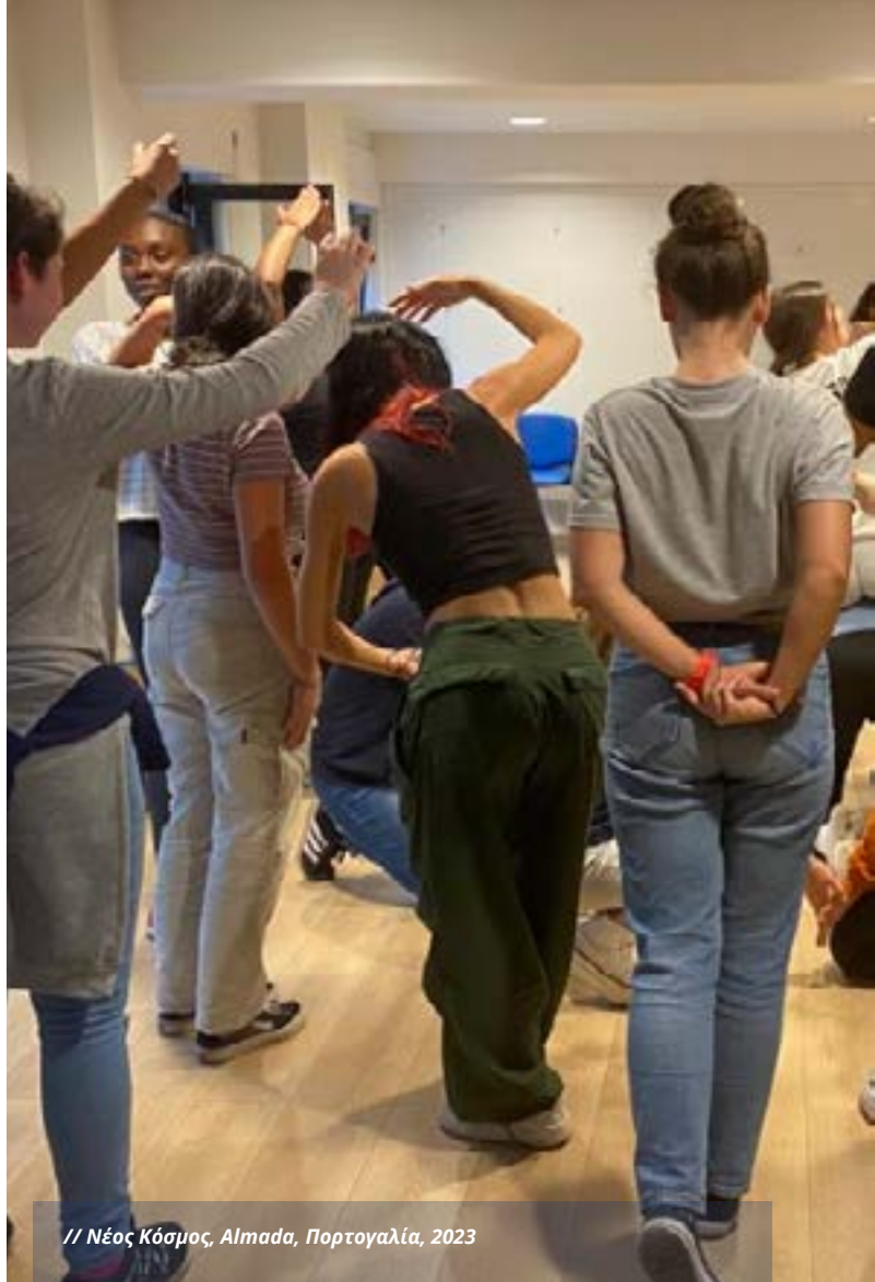
// Νέος Κόσμος, Almada, Πορτογαλία, 2023

Στόχος 5: Ενθάρρυνση των νέων να προβληματιστούν σχετικά με τις προκλήσεις και τις ευκαιρίες στην κοινότητά τους και ενδυνάμωσή τους να προτείνουν λύσεις και να αναλάβουν δράση.