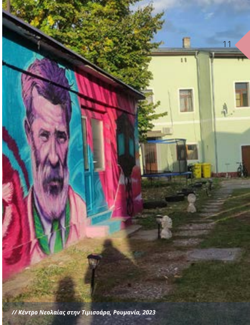
// Κέντρο Νεολαίας στην Τιμισοάρα, Ρουμανία, 2023