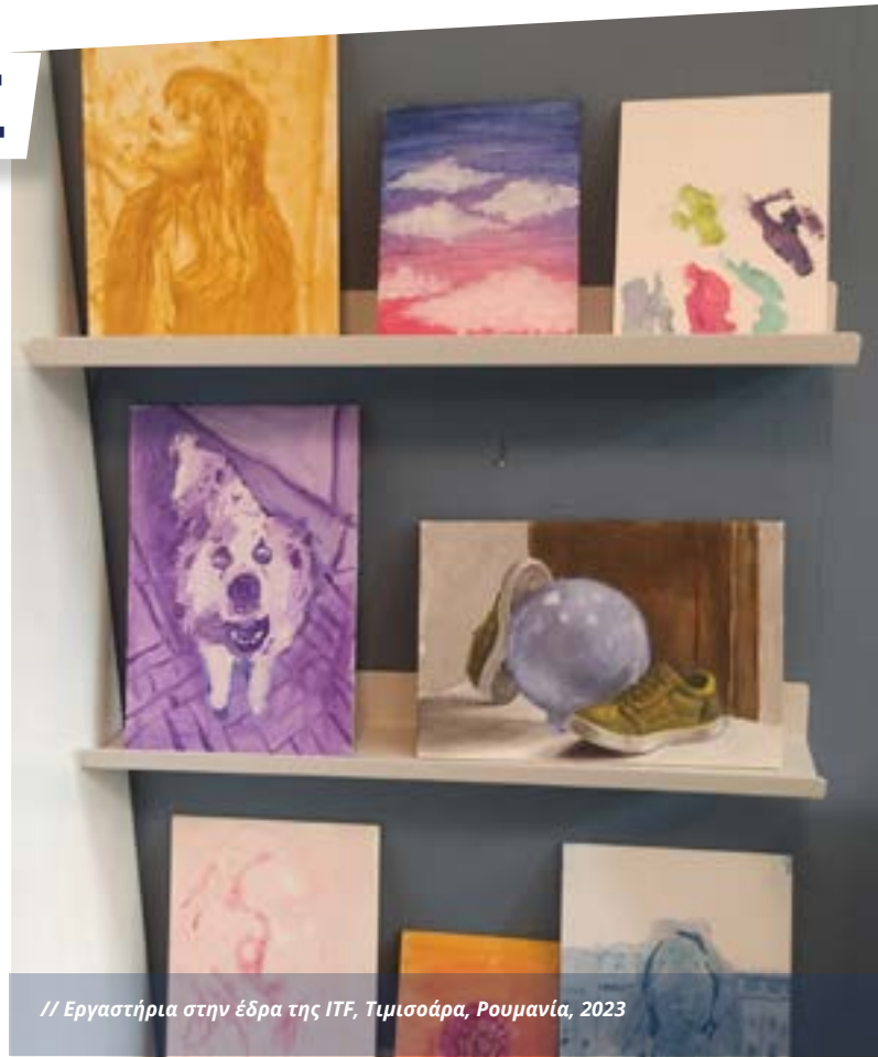
// Εργαστήρια στην έδρα της ITF, Τιμισοάρα, Ρουμανία, 2023

Οι ειδικοί στόχοι αυτής της δραστηριότητας είναι οι εξής: