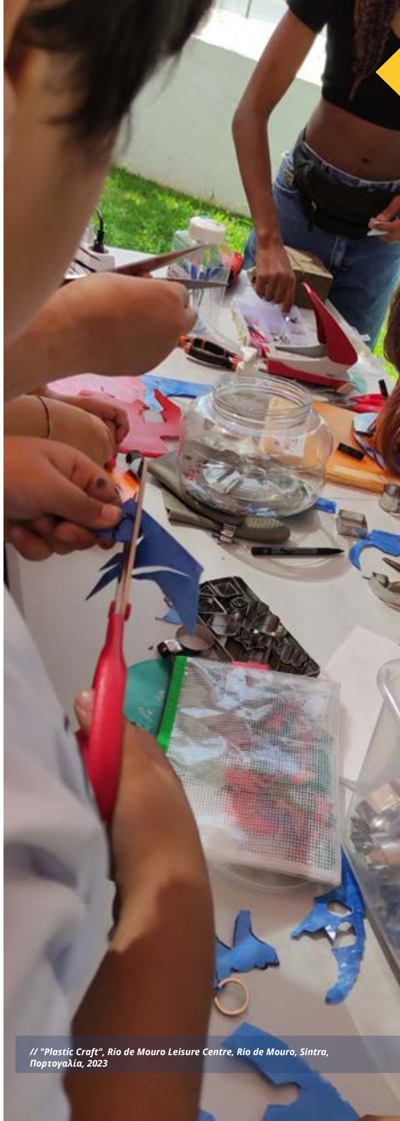
// "Plastic Craft", Rio de Mouro Leisure Centre, Rio de Mouro, Sintra, Πορτογαλία, 2023