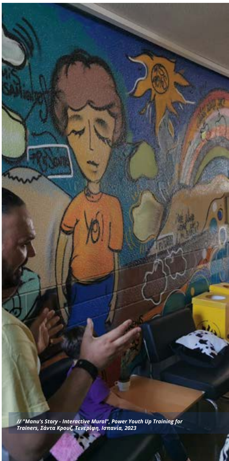
// "Manu's Story - Interactive Mural", Power Youth Up Training for Trainers, Σάντα Κρουζ, Τενερίφη, Ισπανία, 2023