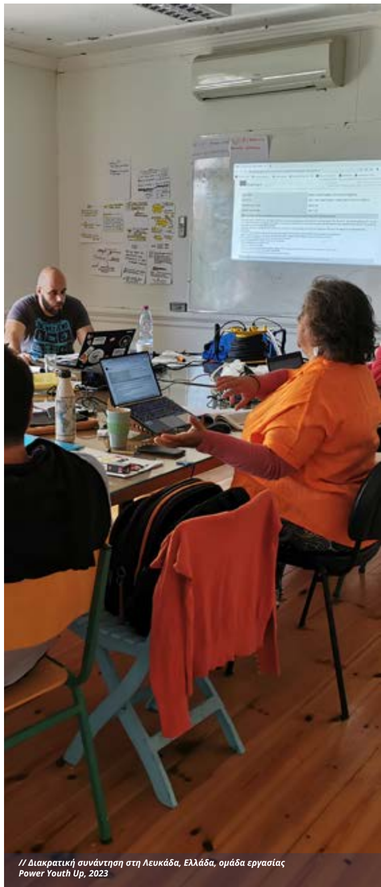
// Διακρατική συνάντηση στη Λευκάδα, Ελλάδα, ομάδα εργασίας Power Youth Up, 2023

β) Εξερευνήστε: Ιδέα και Πρωτότυπο, έγινε εσωτερικά σε επίπεδο κάθε οργανισμού-εταίρου που συμμετείχε σε αυτό το έργο, όπου οι εργαζόμενοι στον τομέα της νεολαίας χρησιμοποιώντας δημιουργικές μεθόδους